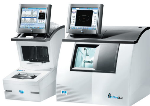
Les configurations Mr Blue 2.0