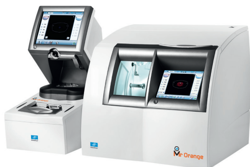
Les configurations Mr Orange